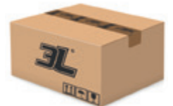
120 pares caja 120 pairs box